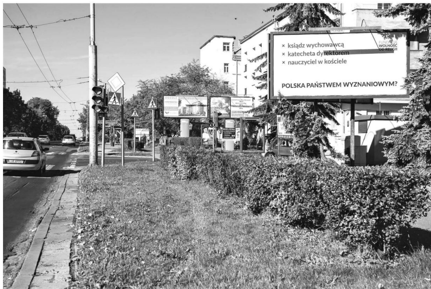
Figuroj 9.1, 9.2, 9.3, 9.4 (Daŭrigo)

La afiŝtabuloj estis tie dum malpli ol du monatoj, sed ili kaŭzis grandan nombron da reagoj. Antaŭ ĉio, la tuta kampanjo estis bone raportita en la amaskomunikilaro. Homoj demandis sin ĉu ĝi celis antaŭenigi ateismon aŭ manifesti en publika spaco la fakton, ke ateistoj entute ekzistas. La eventoj, kiuj okazos apud la afiŝtabuloj, ŝajnis paroli por ĉi-lasto. Polaj nekredantoj, ĉefe per Fejsbuko, kunvenis por fari grupfotajn antaŭ la afiŝtabuloj. Tiuj fotoj poste estis afiŝitaj en Fejsbukon kiel kolektiva manifestiĝo de ateisma identeco. Ekde tiam, la kampanjo ripetiĝis ĉiujare. Dum ni skribas ĉi tiujn vortojn, la sekva – kvina – instalado de la kampanjo ĵus komenciĝis.