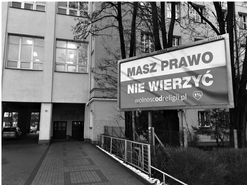
Figuroj 9.1, 9.2, 9.3, 9.4 Afiŝtabulo-kampanjo en Pollando.

Novembro 2012 vidis senprecedencan eventon en Pollando. Dekduo da urboj (inkluzive de la plej grandaj) montris afiŝtabulojn prezentantajn ateisman enhavon. 16 La kampanjon iniciatis la Fondaĵo Lublina Libereco de Religio. La fondaĵo disvastigis informojn pri la bezono de libervolaj financaj kontribuoj vaste per sociaj amaskomunikiloj (plejparte Facebook), kaj la donacoj financis la kampanjon tute. La unua eldono de la kampanjo uzis du dezajnojn por la afiŝtabuloj. Unu legis "Ĉu vi ne kredas je Dio? Vi ne estas sola" kaj la alia "Mi ne mortigas. Mi ne ŝtelas. Mi ne kredas". Jen ekzemploj, kiel ili enkadriĝis en la urbaj pejzaĝoj. 17