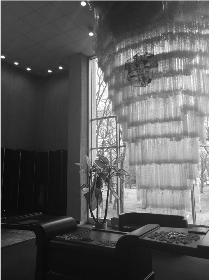
Figuro 8.1 Ĉambro de geedziĝa rito en la Vilna Palaco de Geedziĝoj. 2017.

En 1974, la Vilna Palaco de Geedziĝoj estis konstruita; ĝis nun okazas tie sekularaj ritoj de geedziĝoj (vidu figuron 8.1). En 1979, gvidlinioj estis publikigitaj sur kiel festi burĝajn ritojn (Streikus 2003). La ŝanĝoj ankaŭ okazis en aliaj lokoj. Ekzemple, la kutima tago de fastado en Katolikismo estis vendredo, kiam kredantoj detenis manĝi viandon. Dum sovetiaj tempoj, oficiala fiŝtago estis anoncita ĵaŭde, kio signifis ke lernantoj aŭ laborreligiuloj estis devigitaj konsumi viandon vendrede kiam ili manĝis en publikaj lokoj. En 1982, la Centro de Scienca Ateisma Esploro estis establita en Vilno kaj filio de la Socia Scienca Akademio ĉe Sovetunio.