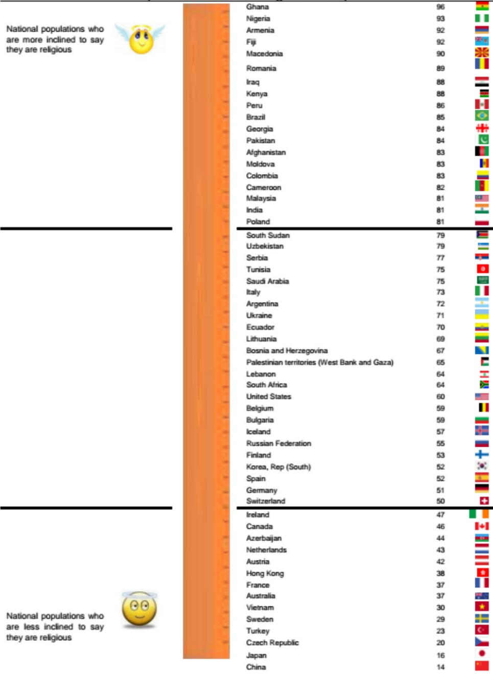
Table 1 GLOBAL RELIGIOSITY INDEX FOR 2012 (Rank ordered from 'High' to 'Low')