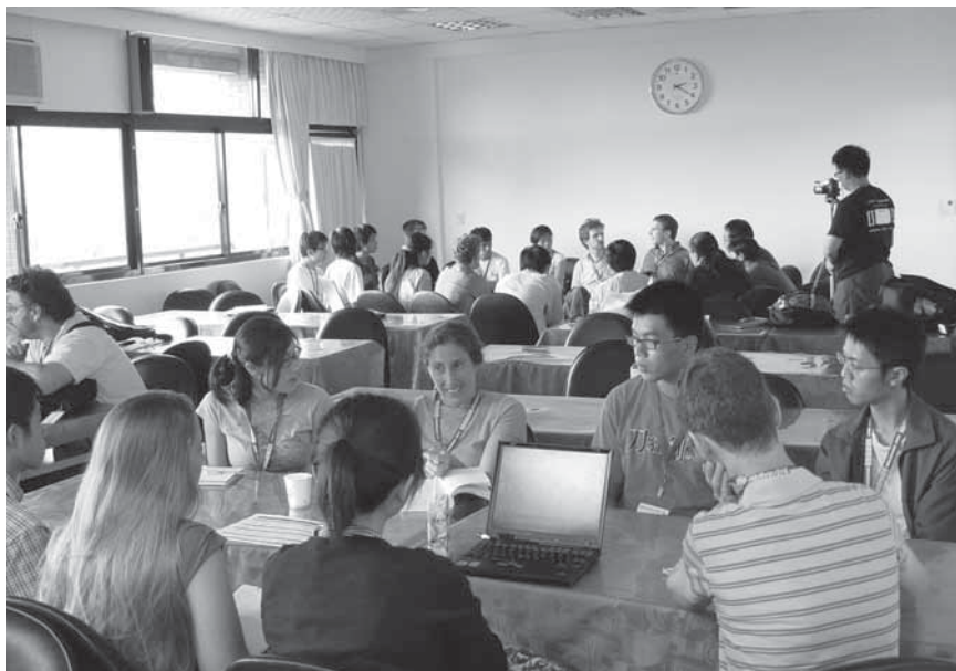
Vikipediistoj dum vikimedia kunveno, Tajpeo 2007