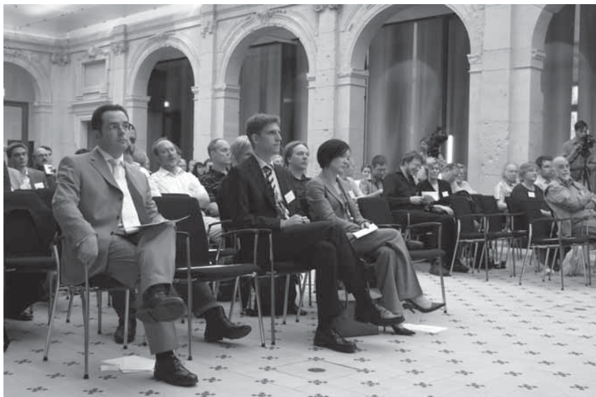
"Wikipedia Akademio", kunveno en Berlino 2008.

Kaj en Esperantio kelkaj vikipediistoj, la wikipediaj asistantoj , proponas al esperantistoj ne spertaj pri komputiloj doni tekstojn, kiujn la asistantoj envikipediigas. Tiel oni ebligas ankaŭ al tiuj esperantistoj, ofte fakuloj pri esperantista temo, kontribui kaj tiel pliriĉigi nian enciklopedion. Pri wikipediaj asistantoj vi trovos pli da informoj en paĝo 54.