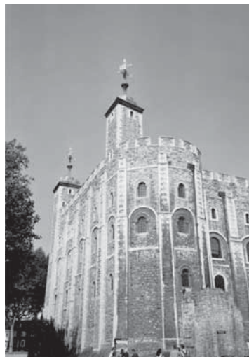
La Blanka Turo.

(Fakte, tiu proceduro funkcias nur se la bildo vere troviĝas en la Komunejo, kaj ne estis alŝutita nur al la anglalingva Vikipedio. Se oni alŝutis ĝin nur al iu Vikipedio, tiam eblas uzi ĝin nur en tiu lingvo-versio, ĉar la alilingvaj Vikipedioj ne rekonas la ligilon. La koncerna bildo-paĝo en Vikipedio montras kie ĝi troviĝas originale, ĉu en tiu Vikipedio aŭ en la Komunejo.)