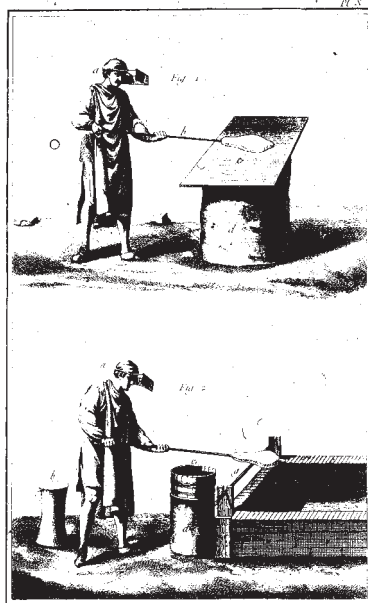
Vitrofarado, bildo el la Encyclopédie, volumo 9, Parizo 1772

Presita enciklopedio devas ĉiam batali kun la dilemo, ke malgranda verko postulas limigon de la enhavo kaj povas pritrakti la temojn nur relative supraĵe, kaj ke aliflanke granda verko (en pluraj volumoj) estas multekosta.