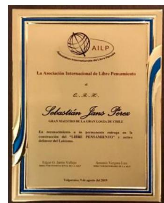
Plakedo de Rekono de la AILP al S-ro