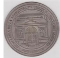
Grandioza Loĝejo de Argentino, Omaĝo al AILP-fondintoj: "PORTA PIA Medalo"