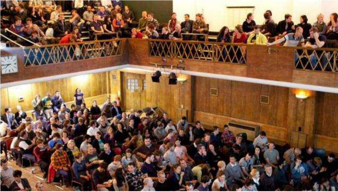
Aŭditorio Conway Hall