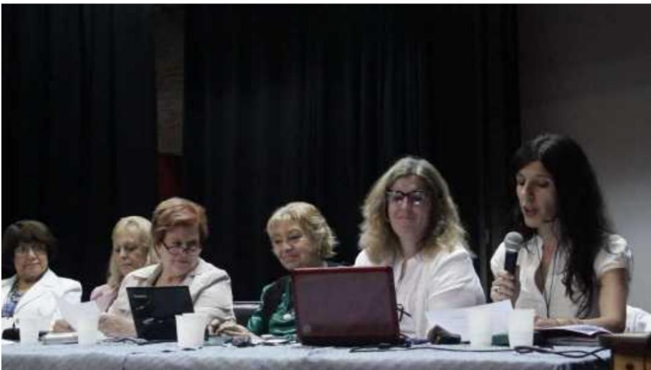
(Panelistoj, Komisiono III: "Virina emancipiĝo en Argentino, Latin-Ameriko kaj la mondo.")

La urbo Mar del Plata estis taŭga medio por okazigi ĉi tiun Kongreson pro la forta ĉeesto de la idealoj de Libera Penso tra sia historio ĝis hodiaŭ. La ĉeesto de tiom da liberpensuloj el la tuta mondo kunvenis tie estis inda kaj justa omaĝo al la luktoj por libereco de konscio kaj civitaj rajtoj, kiuj okazis en ĉi tiu urbo ekde la tagiĝo de la 20-a jarcento.