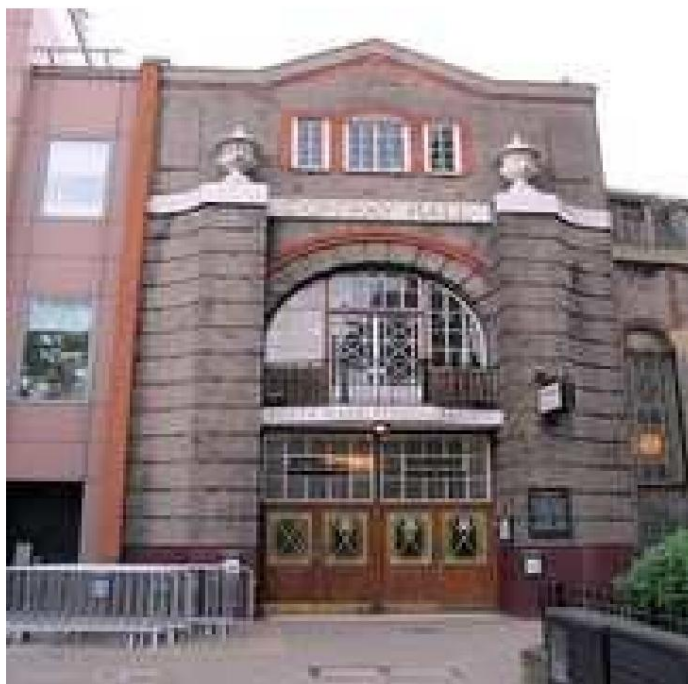
Fronto de Conway Hall en Londono

Kun la pliiĝo de faŝismo en Hispanio, li komencis proponi, ke necesas batali por konservi pacon longtempe. Malgraŭ lia subteno por brita partopreno en 2-a Mondmilito, li funkciis kiel Prezidanto de la "Centra Estraro de Konsciencaj Objetoj" dum la milito, kaj daŭre funkciis kiel Prezidanto ĝis sia morto.