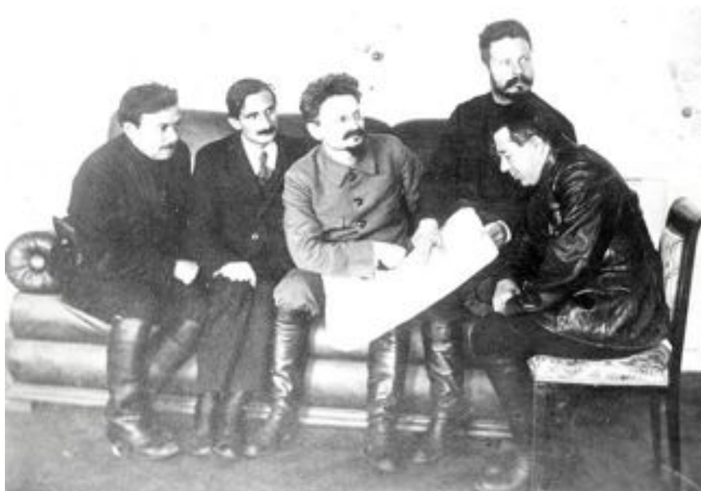
Rosmero (dua de maldekstre), sidanta apud Trockio (meze) kaj aliaj sovetiaj altranguloj, ĉ. 1920