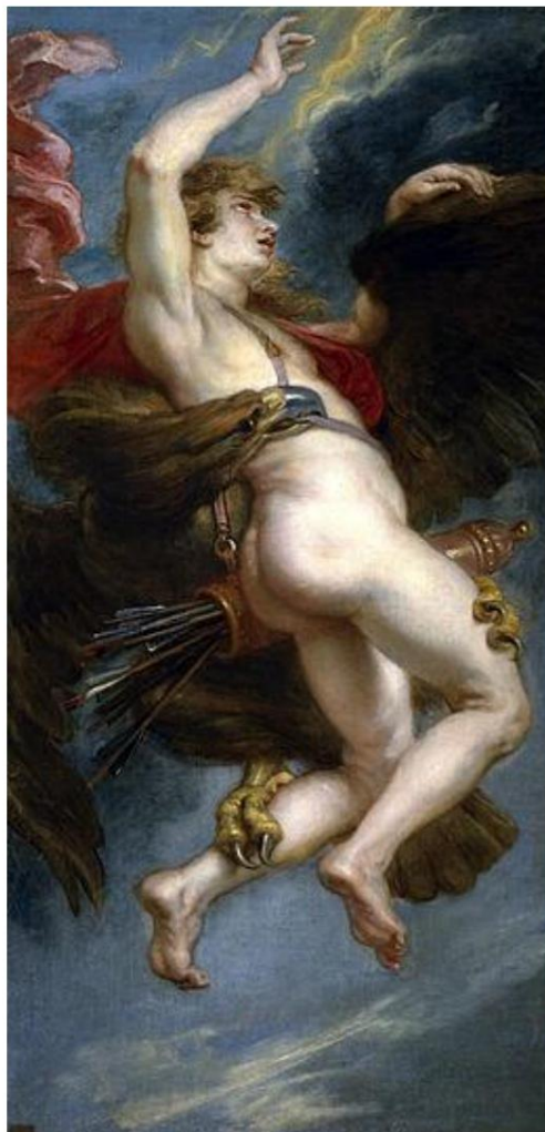
Pierre-Paul Rubens (1577-1640) - La Seksperto de Ganimedo (1638) - Prado-Muzeo

Civitanoj, civitanoj, kamaradoj, karaj amikoj,