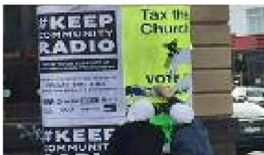
Monaĥinoj malkonstruas afiŝojn en Melburno kun la titolo "Imposto