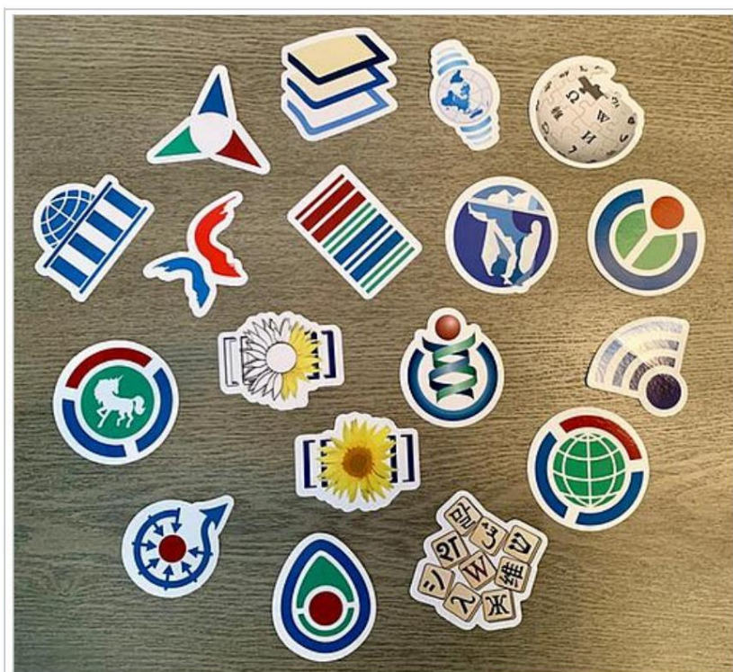
Figuro 1. Serio de glumarkoj prezentantaj la logotipojn de la ĉefaj kunlaboraj projektoj aktivaj ene de la Vikimedia movado.

Laŭ la etimologio de la vorto enciklopedio, la celo de Vikipedio estas efektive sintezi aŭ, pli