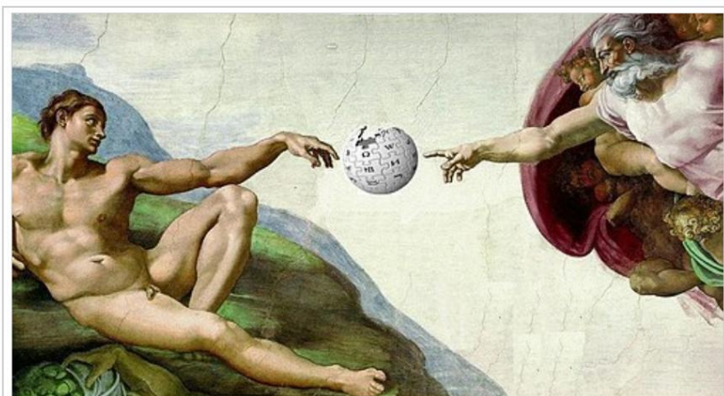
Figuro 2. La kreado de Adamo La verko de Michelangelo revizitata de Vikipedia kontribuanto.

Abundo da arkivoj ekzistas en la reto, permesante al ni spuri la eventojn, kiuj kondukis al la naskiĝo de la movado Wikimedia. Ĉi tiu "antaŭhistorio" de la movado povas esti esplorita, precipe, per la populara edukreto Framasoft, kies retejo aperis proksimume jaron antaŭ la kreado de la franclingva versio de Vikipedio. Ĉi tiu platformo ofertas trezoron da informoj pri libera programaro kaj libera kulturo, du gravaj epizodoj en la historio de komputiko kaj interreto, bedaŭrinde malmulte konataj al la ĝenerala publiko.