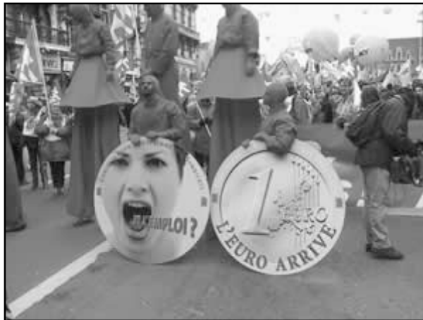
Aludo pri la baldaŭa alveno de eŭro

lingvo kun resumo en nederlanda. Ni restis sufiĉe longtempe por aŭskulti plurajn asociojn inter la 80 anoncitaj. Krom la kutimaj, venis delegitoj de asocioj por Palestino kaj Kamerunio kiuj alparolis la Eŭropajn ŝtatojn cele ke ili ĉesu siajn hipokrita-