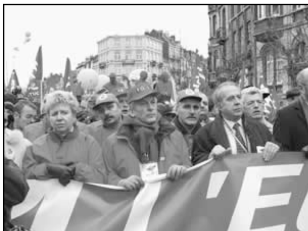
Sindikatoj kaj asocioj aktive partoprenis