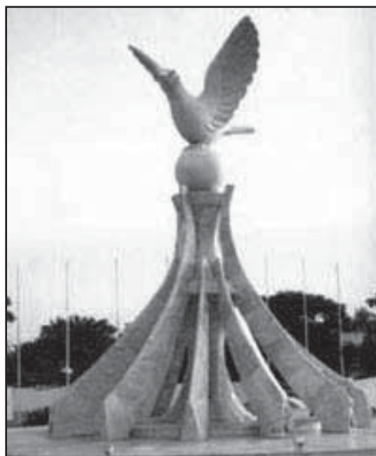
Monumento por la paco - "Packolombo"

Post milito de pozicioj en tranĉeoj dum pluraj monatoj, en 1917 la franca stabo decidis ataki por rekonkeri la okupitan grundon per la Germanoj. Dum tiuj ofensivoj 180 000 francaj soldatoj mortis en 3 semajnoj. Tiam, kiam la antaŭaj ribeloj estis precipe individuaj ribeloj, en 1917