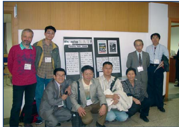
Ĉeestantoj de SAT-kunsido post la fakkunsido

La 8-an de oktobro 2005 estis la memorinda tago por koreaj esperantistoj progresemaj ĉar en tiu tago okazis la unua fakkunsido de SAT en la longa historio de sudkorea Esperanto-movado.